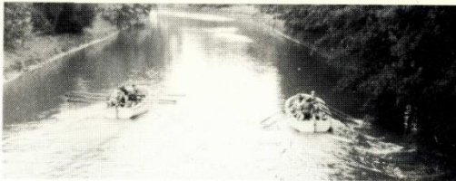
Spannendes Kutterrace auf der Oker.