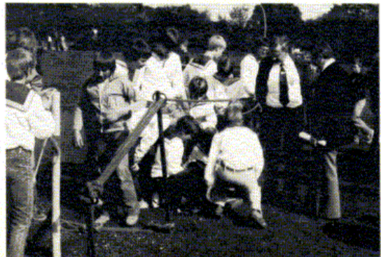
Letzte fachmännische Gespräche an der Knotenbahn, bevor es um Sekunden geht.