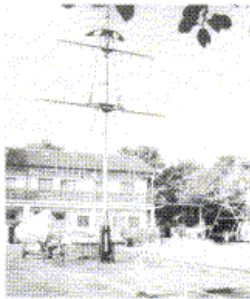
Landesessportschule in Hagen Anläßlich des 20jährigen Bestehens der MJ Hagen im Jahre 1976 wurde das schöne Jugendheim fertiggestellt.

Danach lief ein Programm ab, daß alle Besucher zufriedenstellte. Einen hervorragenden Beweis ihres Könnens lieferte der »Shanty-Chor Bündes. Sein Auftritt war sicherlich der Höhepunkt des Abends. Aber auch »The Swing's«, die Tanzmusik am laufenden Band produzierten, sorgten für gute Unterhaltung. Durch das Programm führte ein bekannter Humorist und Parodist. Eine große Tombola rundete den Abend ab.