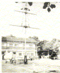
Landesessportschule in Hagen Anläßlich des 20jährigen Bestehens der MJ Hagen im Jahre 1976 wurde das schöne Jugendheim fertiggestellt.

Danach lief ein Programm ab, daß alle Besucher zufriedenstellte. Einen hervorragenden Beweis ihres Könnens lieferte der »Shanty-Chor Bündes. Sein Auftritt war sicherlich der Höhepunkt des Abends. Aber auch »The Swing's«, die Tanzmusik am laufenden Band produzierten, sorgten für gute Unterhaltung. Durch das Programm führte ein bekannter Humorist und Parodist. Eine große Tombola rundete den Abend ab.